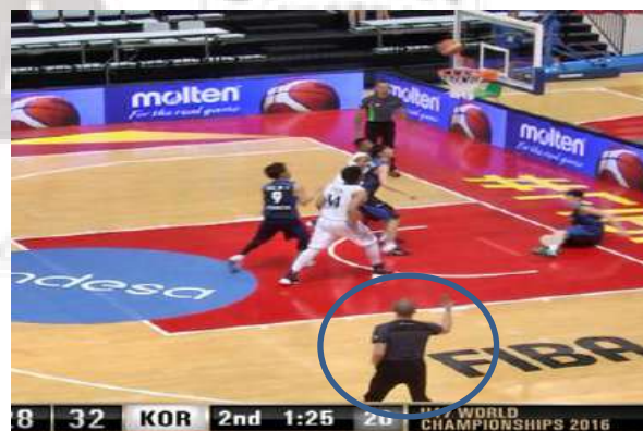
フェイクのジェスチャーを行う（2 回）