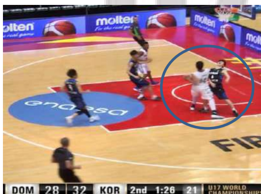
フェイクが起きたことを確認

図のように腕で招くように 2 回シグナルをすることで、フェイクが起きたことを示す